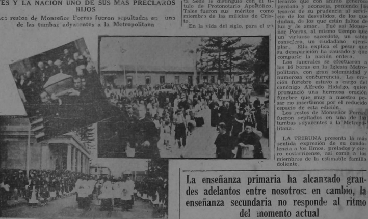
Los restos de Monsenor Porras fueron sepultados en una de las tumbas adyacentes a la Metropolitana.

La Iglesia pierde uno de sus más dignos jefes y la nación uno de sus más preclaros hijos. Una letanía doliente le tuvo postrado durante los últimos días, y vanos fueron los esfuerzos de la ciencia y los solícitos cuidados de sus familiares para prorrogar su vida noble y fecunda. Su muerte viene a poner una nota de profundo dolor en el corazón de los católicos, por